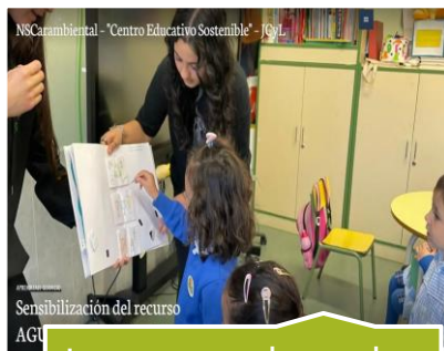
Lectura en las aulas de Infantil